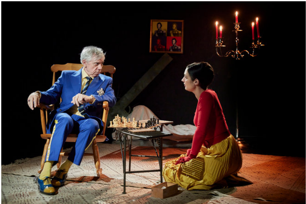
Scène du "Pain dur"