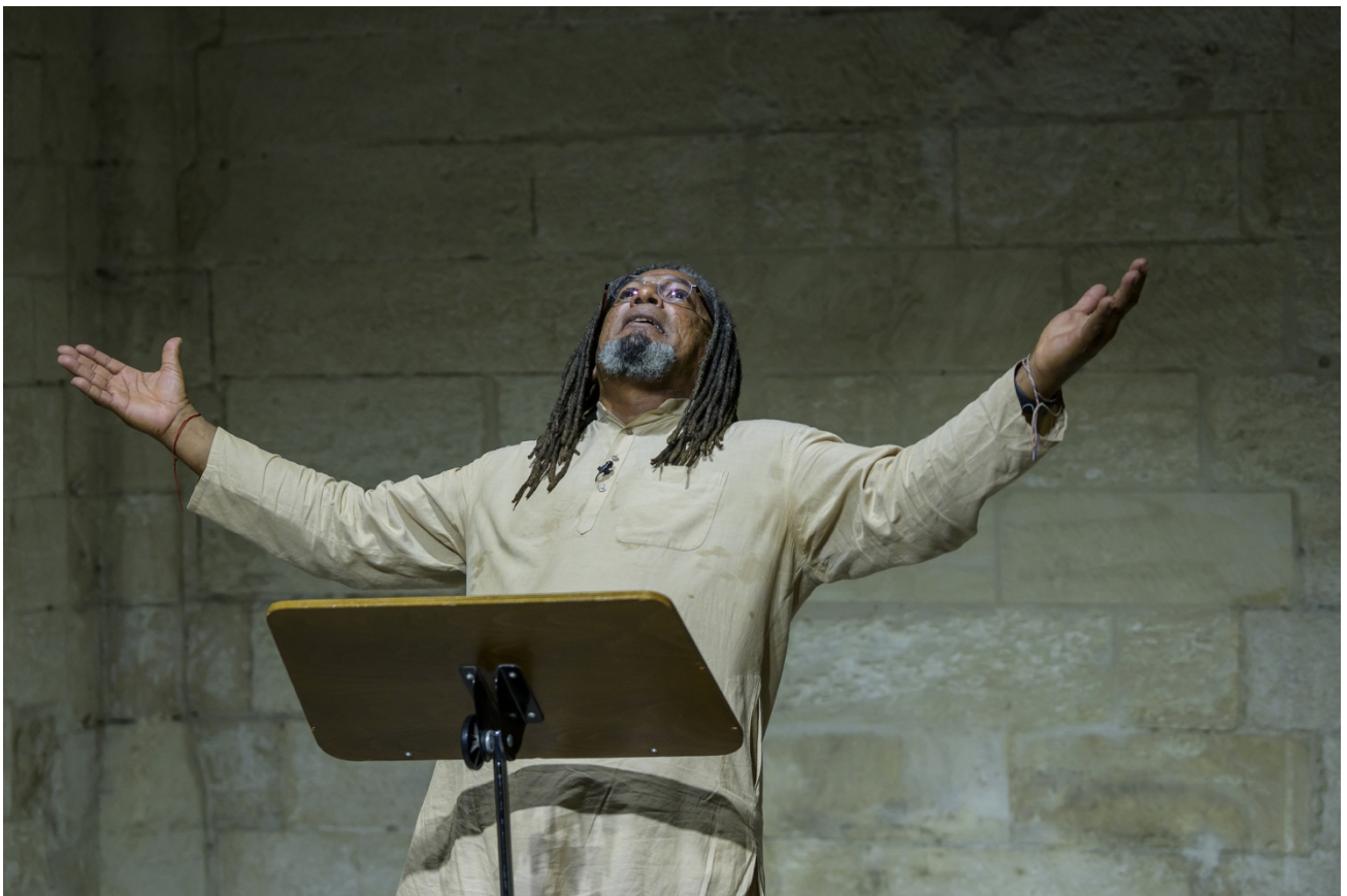
@ Pascal Gely