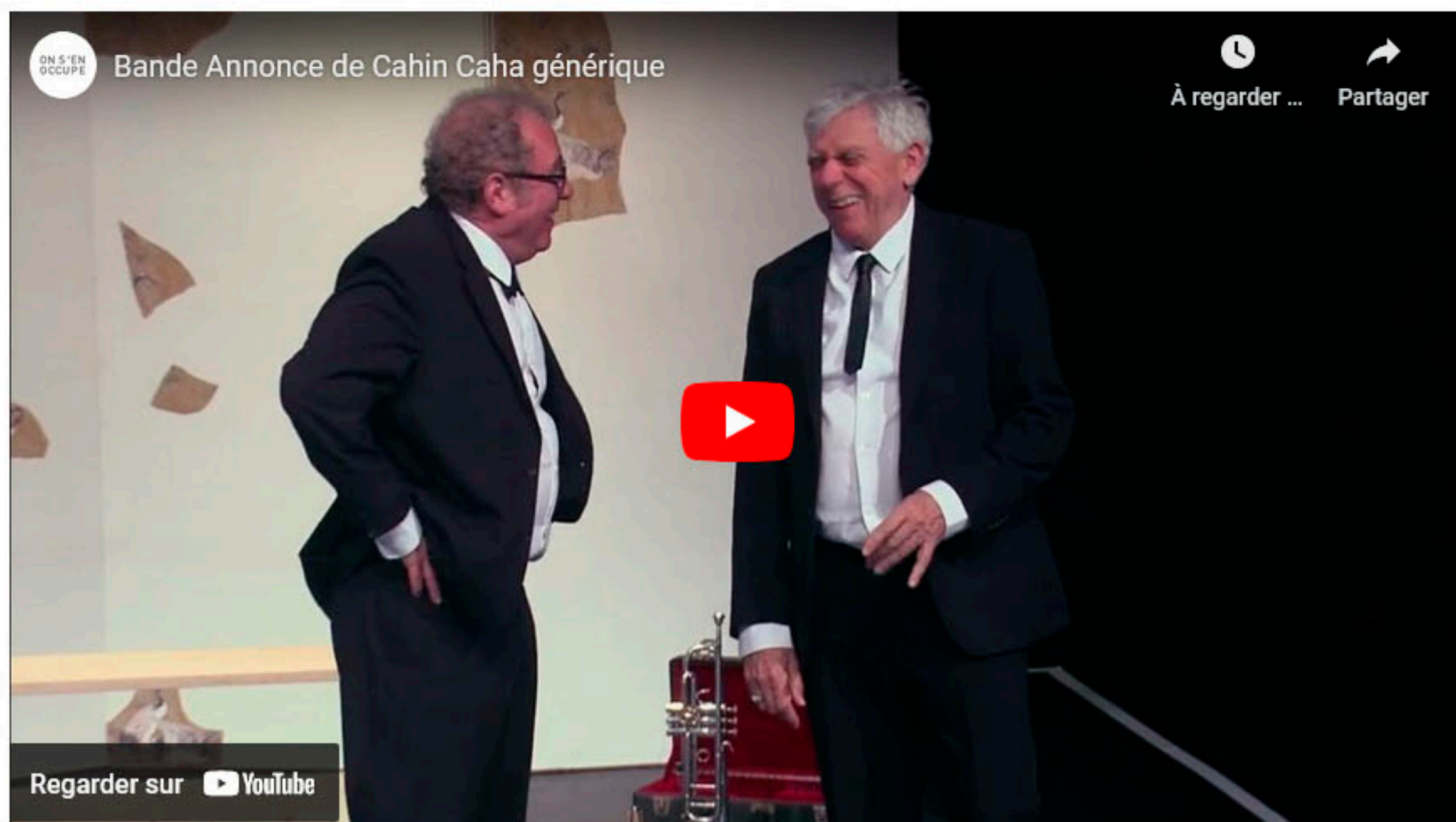
Bande Annonce Cahin Caha © On s'en occupe – Corine Péron