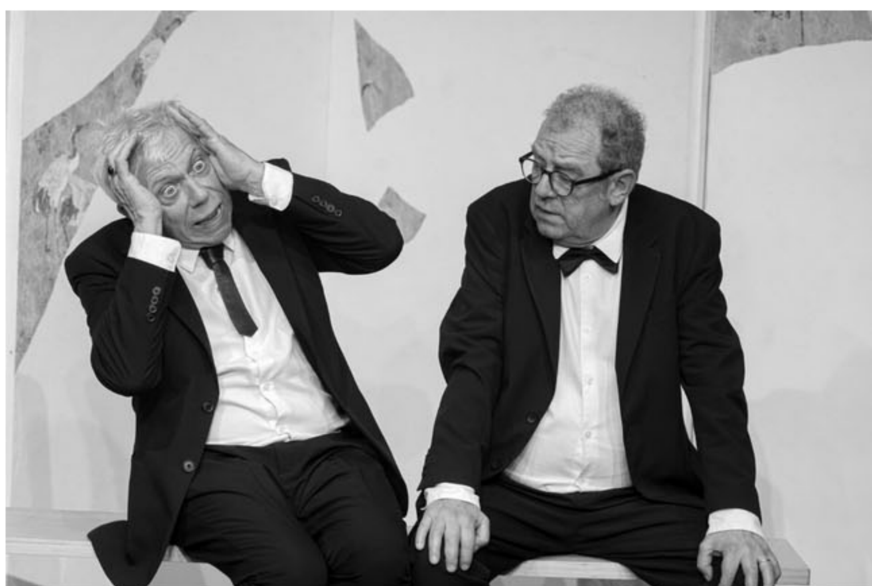
Scène de «Cahin Caha»