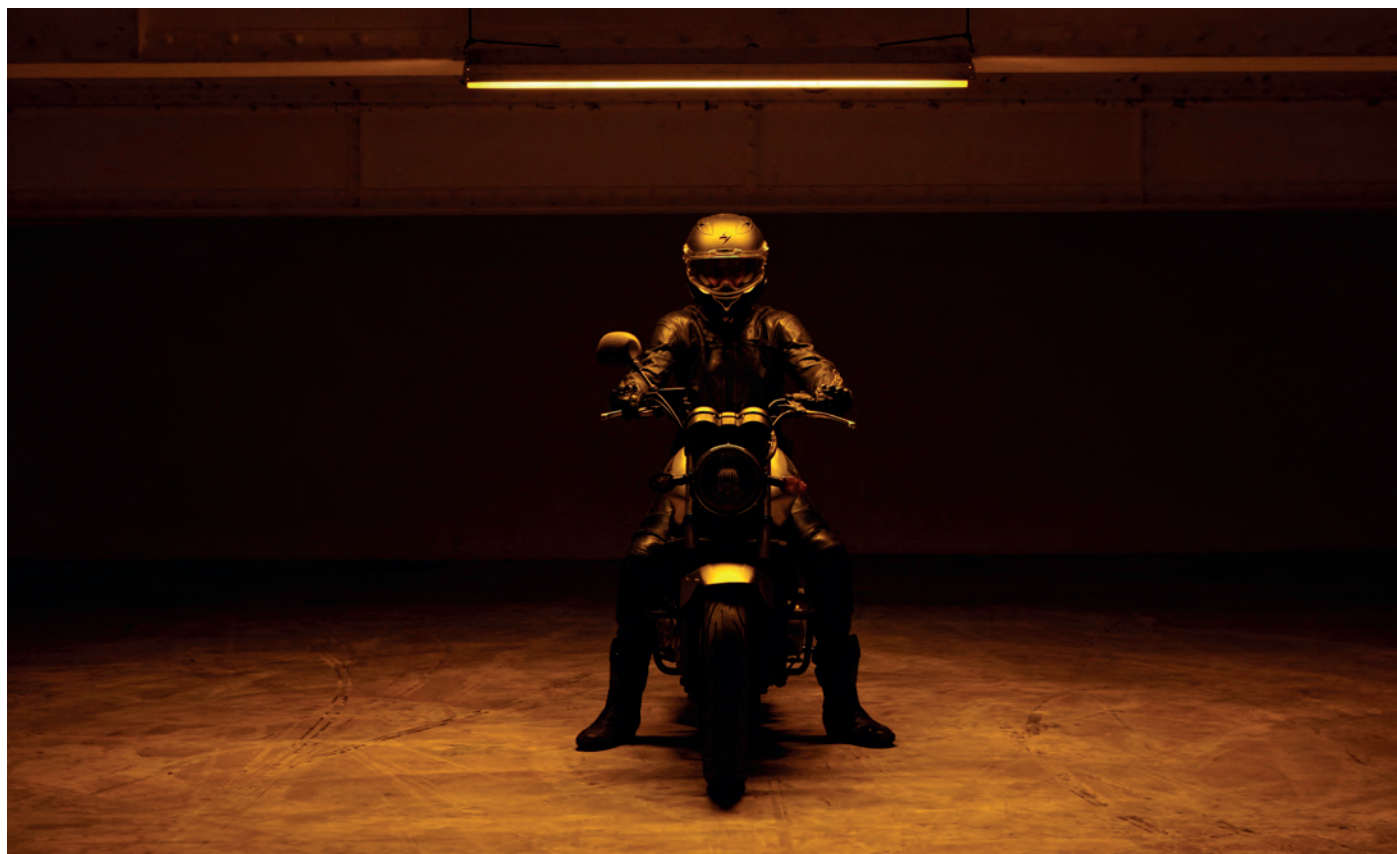
Radio Vinci Park de Théo Mercier & François Chaignaud

1 écho à l'exposition du |mac| dans Prétexte#3 , exposition présentée à La Friche la Belle de Mai du 30 septembre au 16 octobre