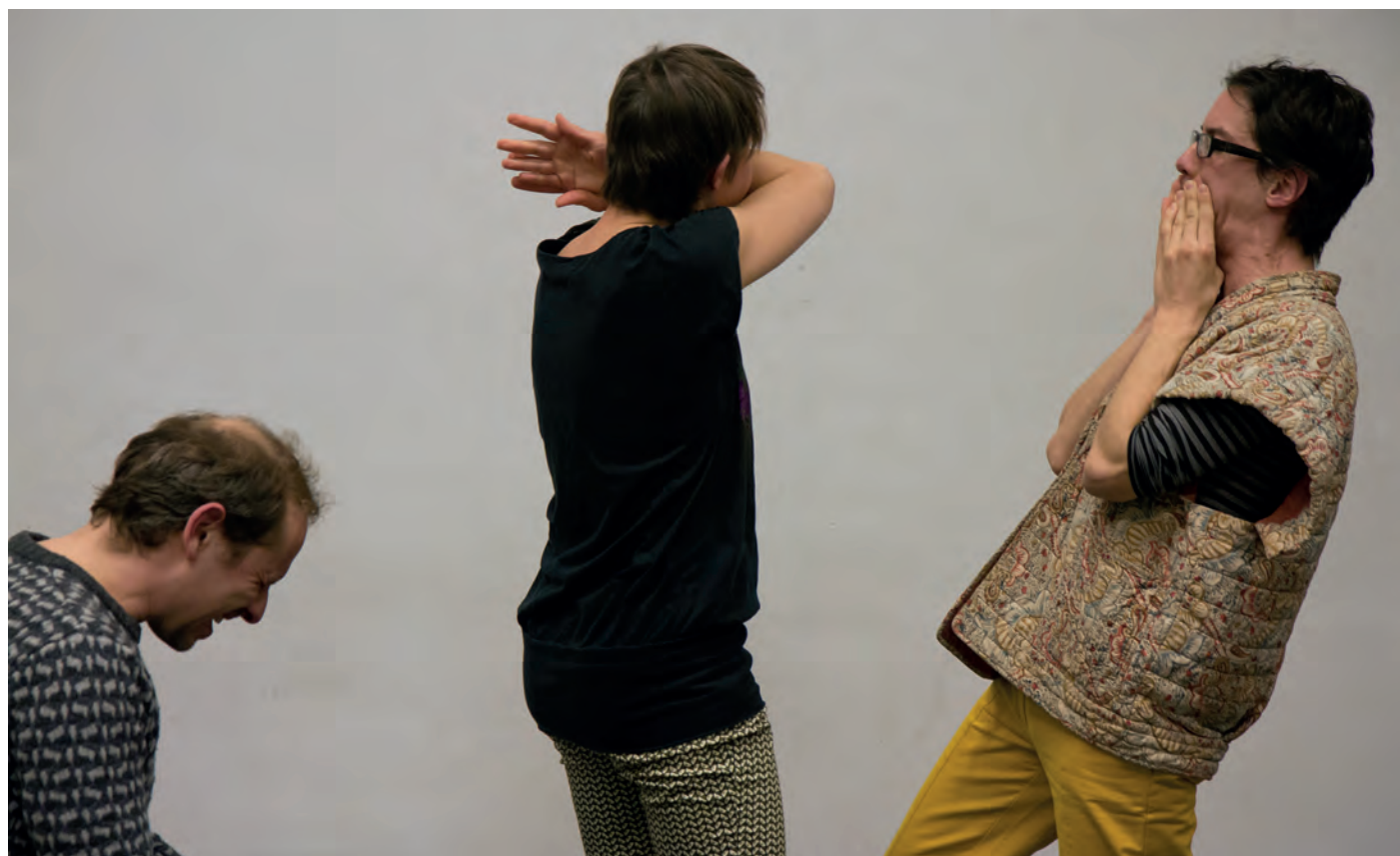
What Nature Says de Myriam Van Imschoot