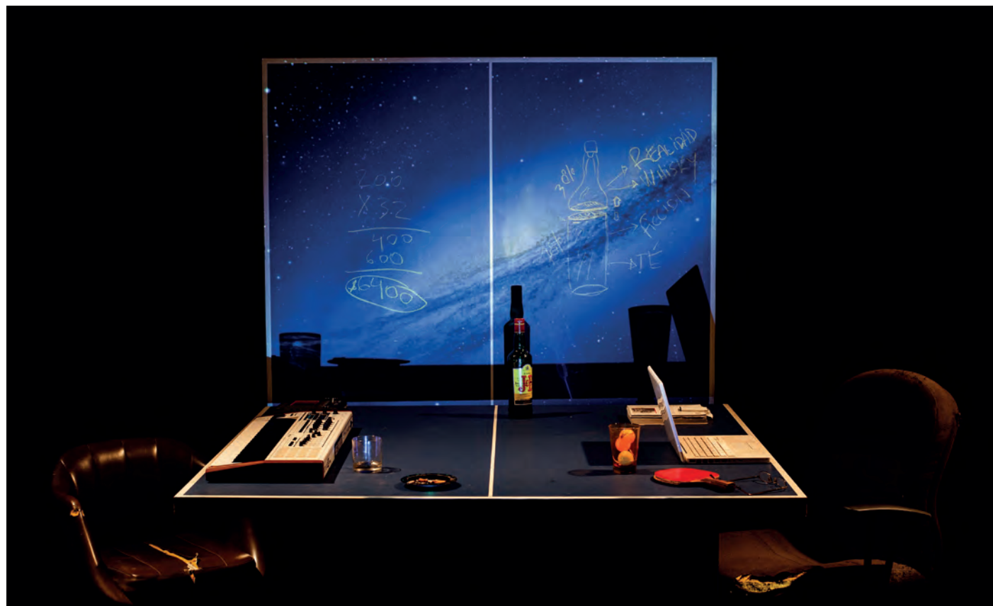
Las ideas de Federico León / © Ignacio Iasparra