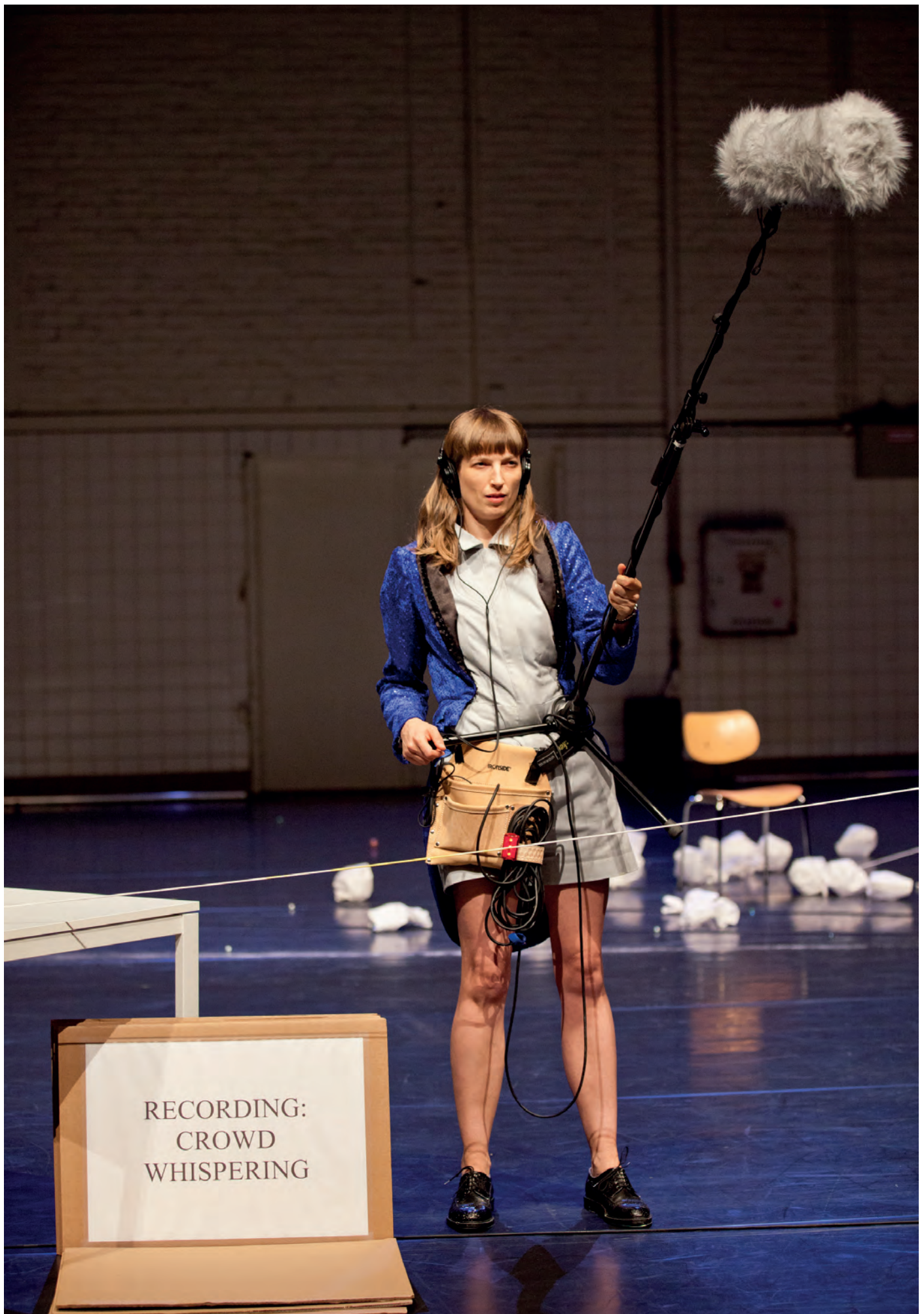
All Ears de Kate McIntosh